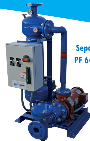
Separatore PF 64 Series