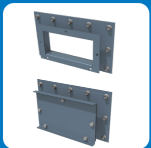
Trappe de nettoyage