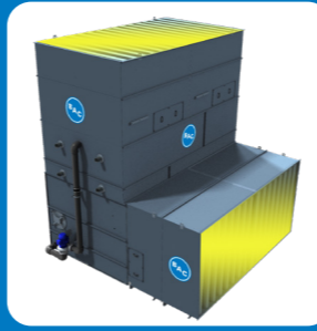
Écrans supplémentaires à l'aspiration & au refoulement