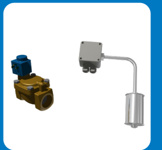
Dispositif électrique de régulation du niveau d'eau