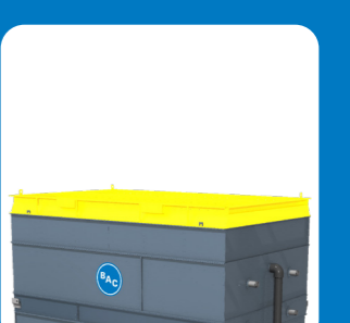
Registres de fermeture**