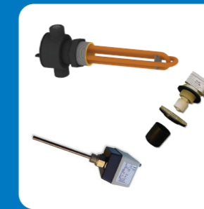
Ensemble de protection antigel de bassin