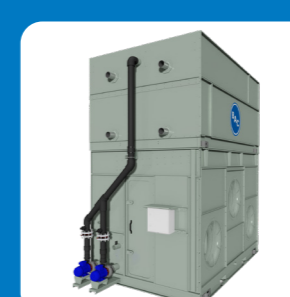
Pompe de pulvérisation de réserve