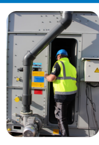
Porte d'accès le côté opposée*