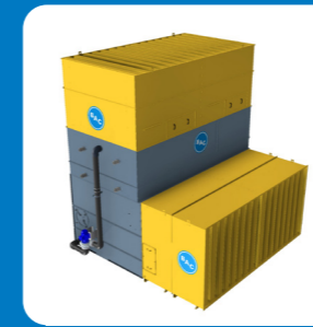
Atténuation acoustique à l'aspiration & au refoulement