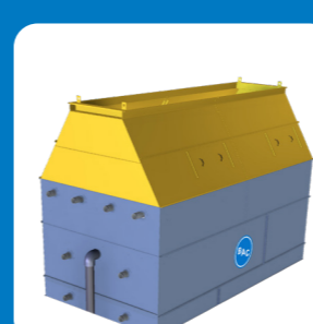
Hotte de refoulement