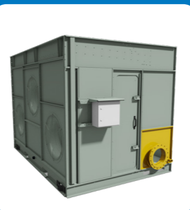
Connexion écoulement surdimensionné